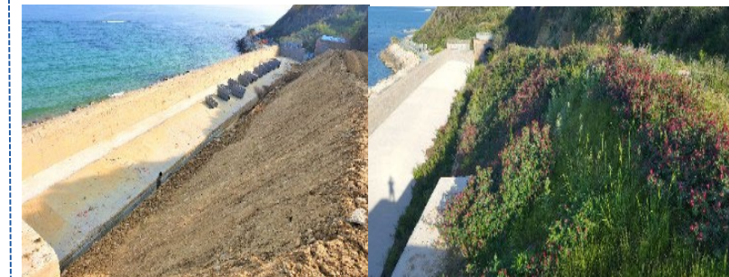
IL CANTIERE ITALFERR di ORTONA (CH) nel 2021 e nel 2022 Un giardino antierosione a bordomare

Ai partecipanti che ne faranno richiesta in sede di iscrizione sarà rilasciato 3 CF gratuito per i Soci CIFI e i dipendenti dei Soci Collettivi