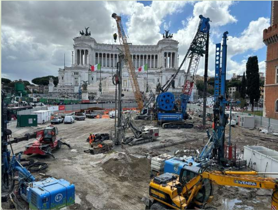
CANTIERE STAZIONE VENEZIA