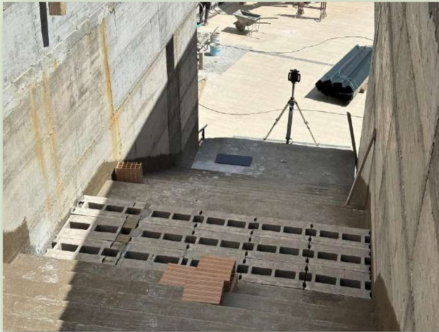
CANTIERE STAZIONE PORTA METRONIA