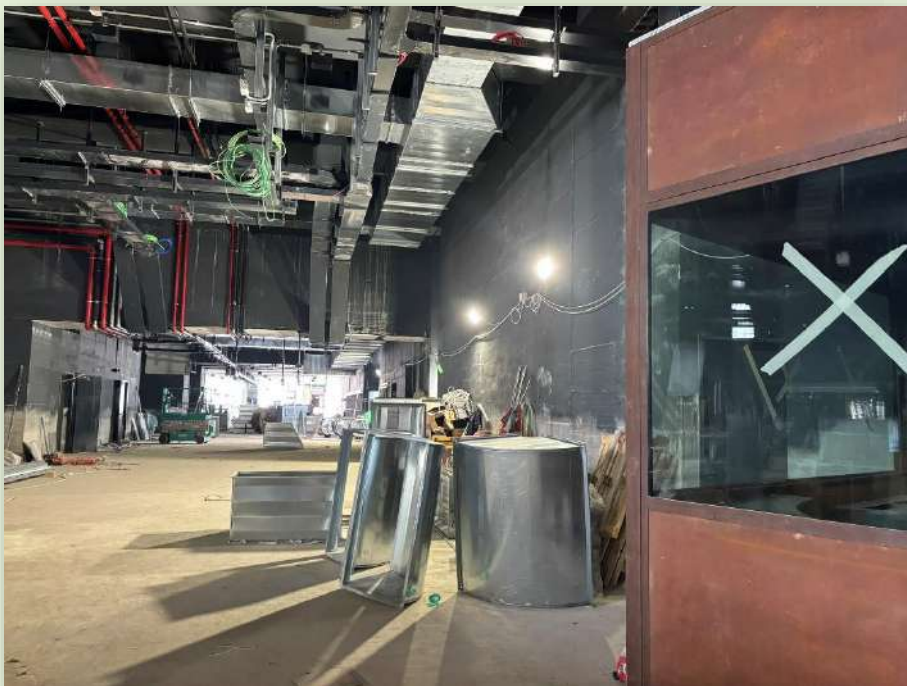
CANTIERE STAZIONE PORTA METRONIA