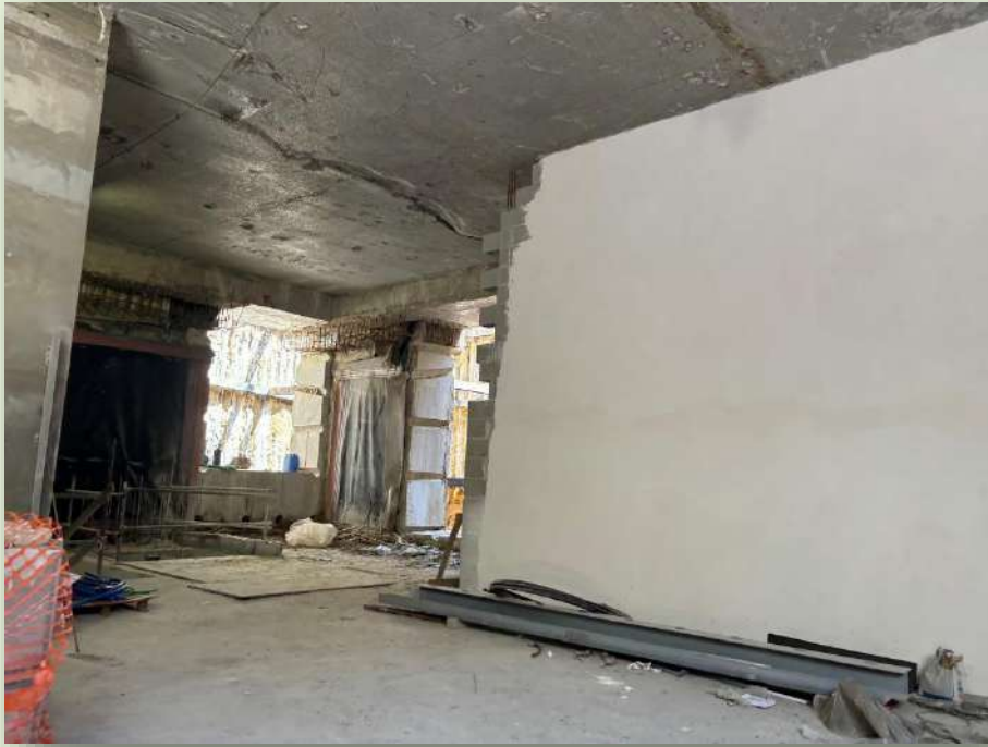
CANTIERE STAZIONE COLOSSEO (FORI IMPERIALI)