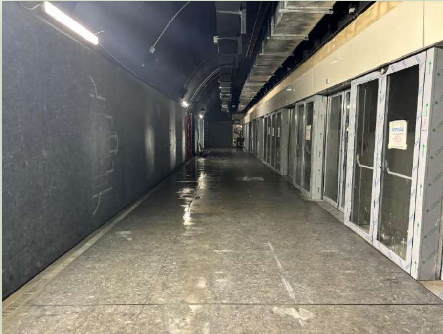
CANTIERE STAZIONE COLOSSEO (FORI IMPERIALI)