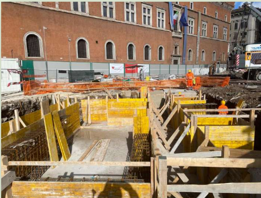
CANTIERE STAZIONE VENEZIA