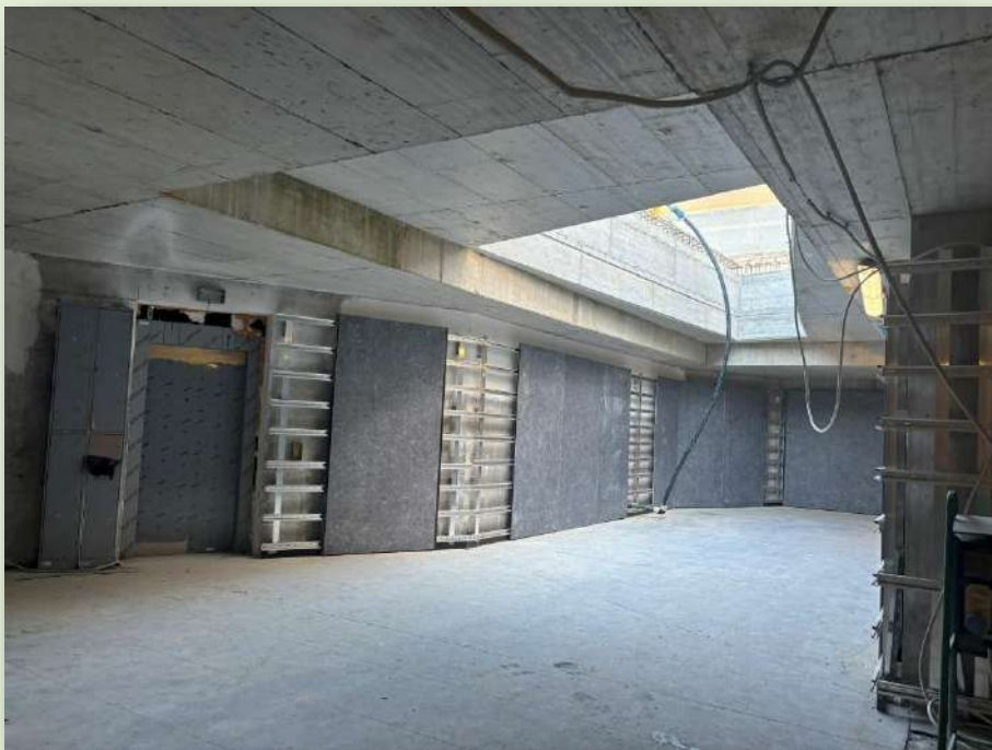
CANTIERE STAZIONE COLOSSEO (FORI IMPERIALI)