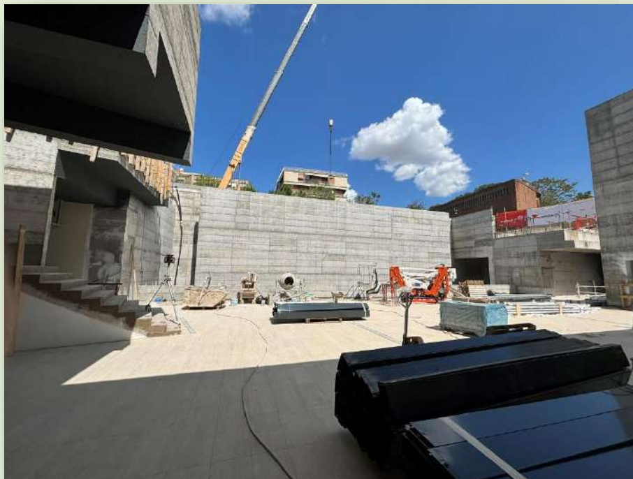
CANTIERE STAZIONE PORTA METRONIA