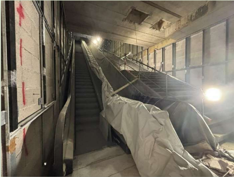
CANTIERE STAZIONE PORTA METRONIA