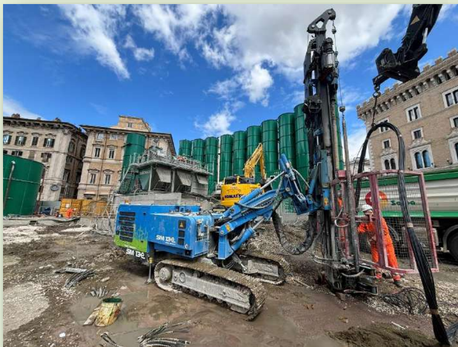
CANTIERE STAZIONE VENEZIA