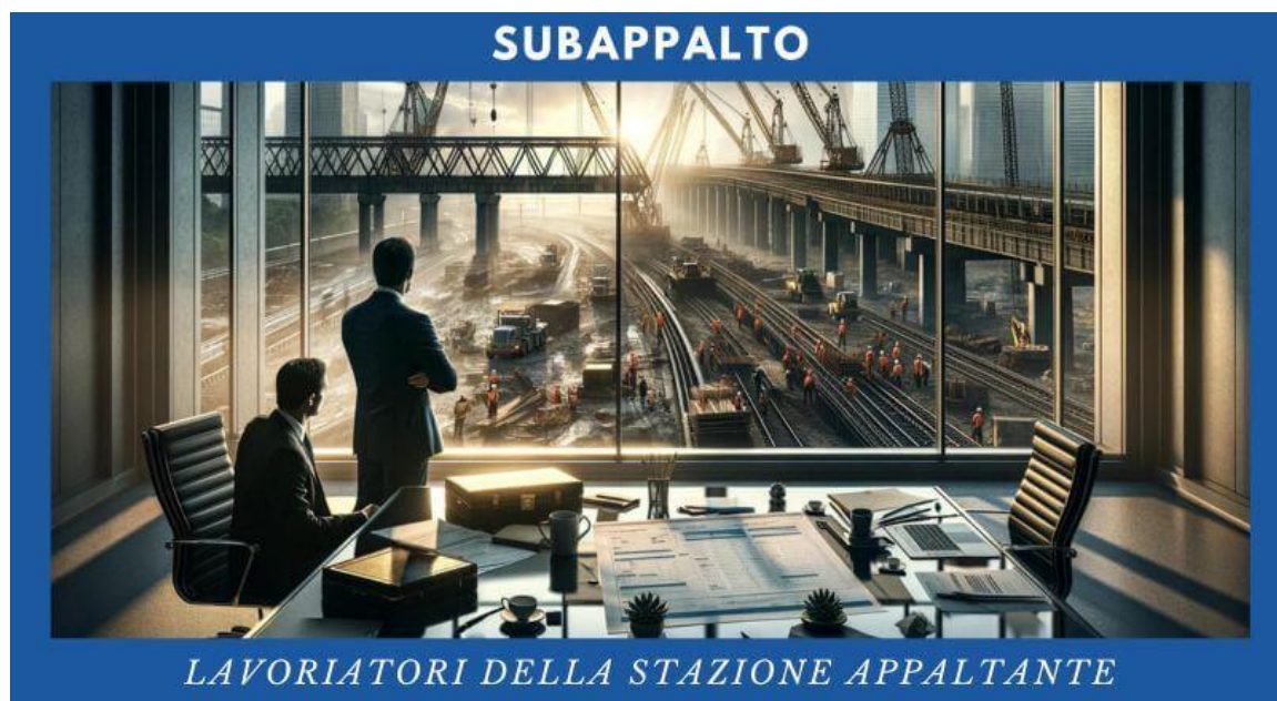
Figure professionali della stazione appaltante: Sono coloro che lavorano per l'ente o l'organizzazione che emette l'appalto per il progetto. Questi professionisti sono responsabili della definizione dei requisiti del progetto, della selezione degli appaltatori e della gestione del contratto. Un corso sul subappalto può aiutarli a comprendere meglio come valutare le proposte degli appaltatori, incluso il loro uso di subappaltatori, e come gestire i rapporti contrattuali complessi.

Un corso sul subappalto in ambito ferroviario è rivolto a diversi professionisti coinvolti nel processo di appalto e gestione di progetti ferroviari. Questo include: