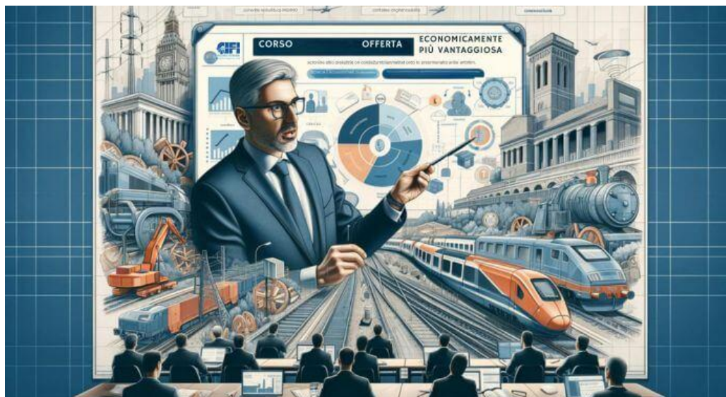
CORSO DI FORMAZIONE