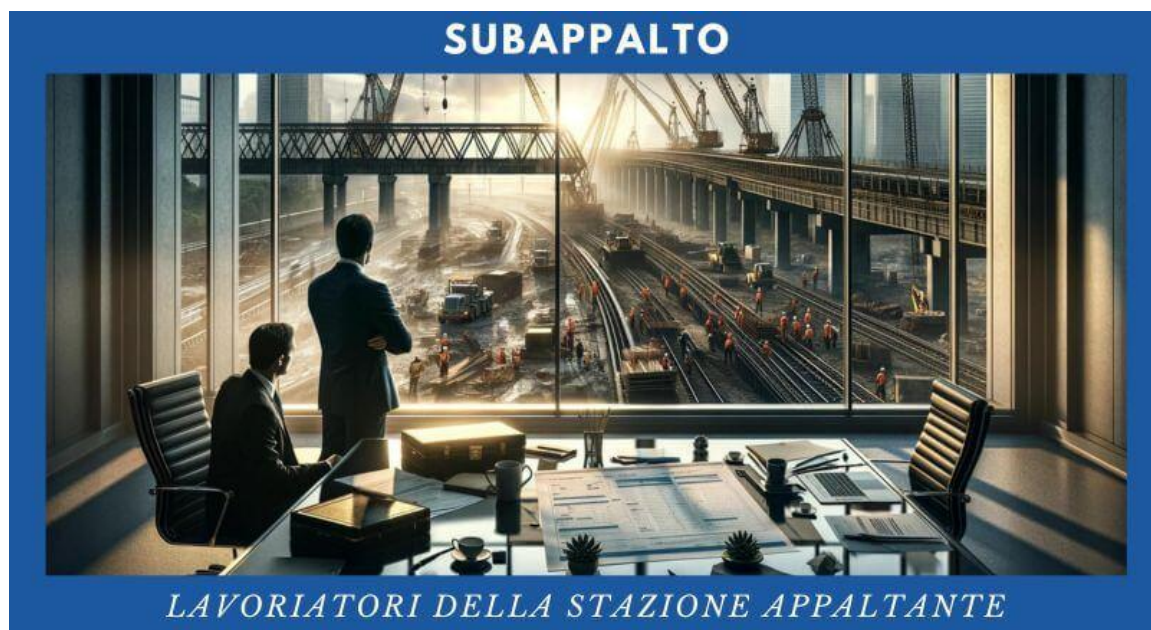
Figure professionali della stazione appaltante: Sono coloro che lavorano per l'ente o l'organizzazione che emette l'appalto per il progetto. Questi professionisti sono responsabili della definizione dei requisiti del progetto, della selezione degli appaltatori e della gestione del contratto. Un corso sul subappalto può aiutarli a comprendere meglio come valutare le proposte degli appaltatori, incluso il loro uso di subappaltatori, e come gestire i rapporti contrattuali complessi.

Un corso sul subappalto in ambito ferroviario è rivolto a diversi professionisti coinvolti nel processo di appalto e gestione di progetti ferroviari. Questo include: